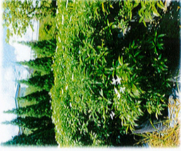
Pokok Bunga Susun Kipas