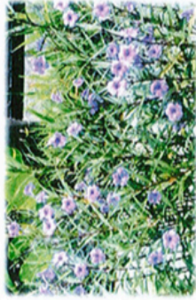
Pokok Bynga Ruelia