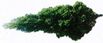
Pokok Cedaz (Krismas)