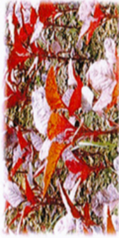
Pokok Bunga Bayam