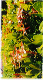
Pokok Bunga Jenjarun (Ixora)